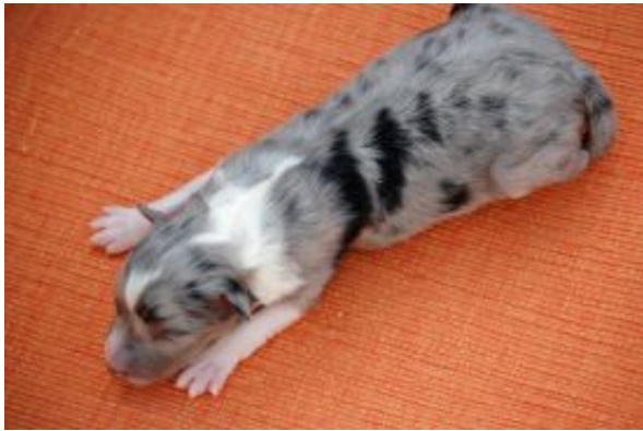
Evita Lady in blue mit wenigen Tagen