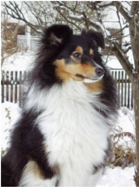
Esmeralda the black Gypsy als erwachsene Hündin

Die tricolour Hündin, ebenfalls mit einer halben weißen Halskrause. Sie hat ein weißes Schnäuzchen. Auch bei ihr sind die Vorderfüße komplett weiß, an den Hinterfüßen hat sie zwei gleichmäßige weiße Stiefelchen an. Sie ist die zarteste der Welpen, aber wohlauf und kräftig. Ein Gesicht wie der Papa. Emma lebt in der Nähe von Wolfratshausen.