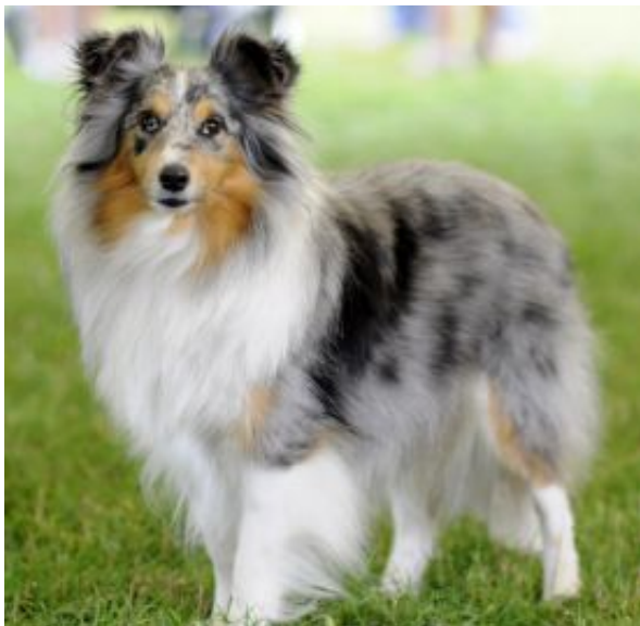
Evita Lady in blue als Junghündin

Eine süße Hündin mit einer wunderschönen gleichmäßigen Zeichnung und einer halben, breiten Halskrause, die sich bis in den Nacken zieht. Die Vorderfüße sind komplett weiß, an den Hinterfüßen hat sie zwei gleichmäßige weiße Stiefelchen an. Im Gesicht hat sie relativ wenig weiß. Sie wird bestimmt mal ein Ebenbild Ihrer Mutter - vielleicht mit weniger weiß und mehr tan (=braun) im Gesicht. Sie hat sogar die beiden schwarzen Flecken an der linken Schulter wie ihre Mutter. Lady ist eine richtige kleine