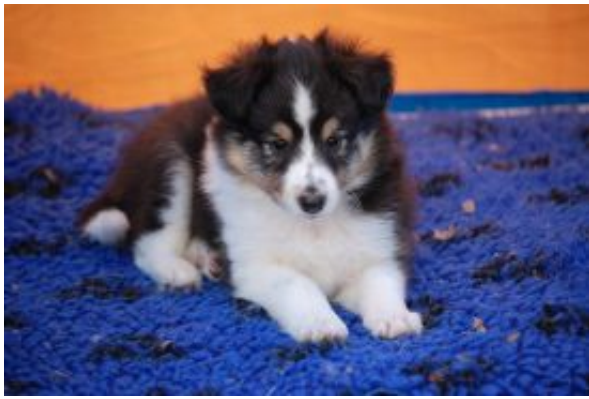
Enzo plays Chess in black mit 7 Wochen