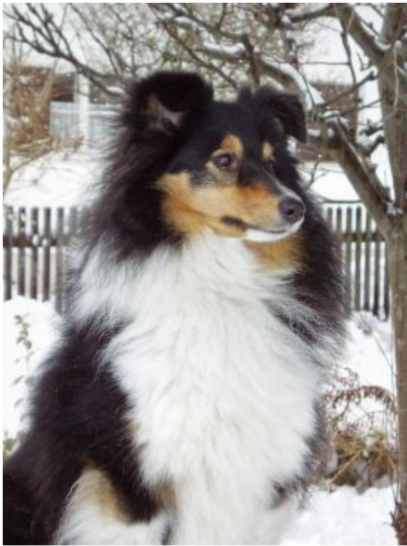
Esmeralda the black Gypsy als erwachsene Hündin

Die tricolour Hündin, ebenfalls mit einer halben weißen Halskrause. Sie hat ein weißes Schnäuzchen. Auch bei ihr sind die Vorderfüße komplett weiß, an den Hinterfüßen hat sie zwei gleichmäßige weiße Stiefelchen an. Sie ist die zarteste der Welpen, aber wohlauf und kräftig. Ein Gesicht wie der Papa. Emma lebt in der Nähe von Wolfratshausen.