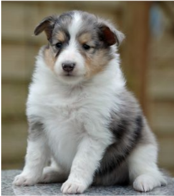
Exciting Starlight Express in blue mit 5 Wochen