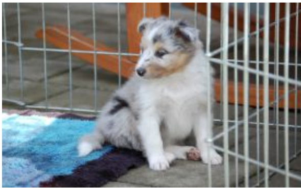
Evita Lady in blue mit 6 Wochen