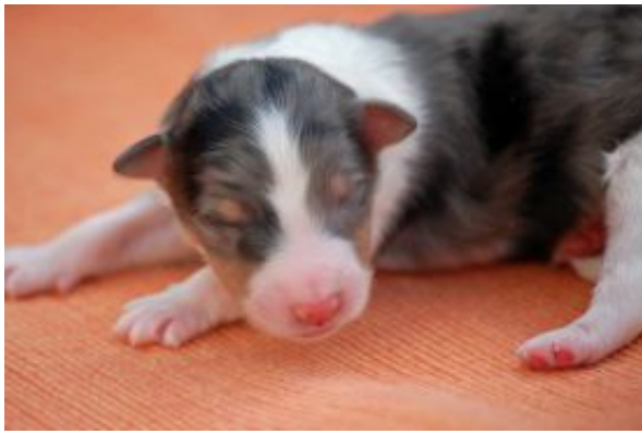
Exciting Starlight Express in blue mit wenigen