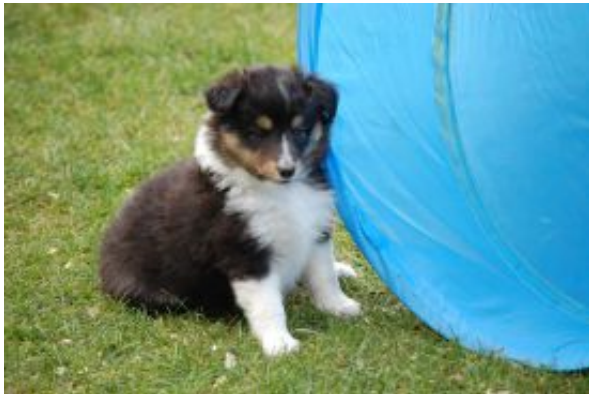
Esmeralda the black Gypsy mit 6 Wochen