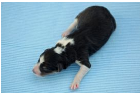
Enzo plays Chess in black mit wenigen Tagen