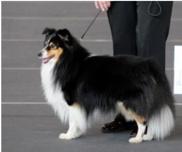
Enzo plays Chess in black auf einer Ausstellung

Ein knuddeliger Rüde, ebenfalls halbe weiße Halskrause. Er hat zusätzlich noch einen weißen Schopf. Im Gesicht hat er viel Weiß. Die Blesse auf der Stirn hat er von Mama geerbt. Die Vorderfüße sind komplett weiß. Ein Hinterfuß ist deutlich weiß faktoriert. Ein Bild von einem Rüden.