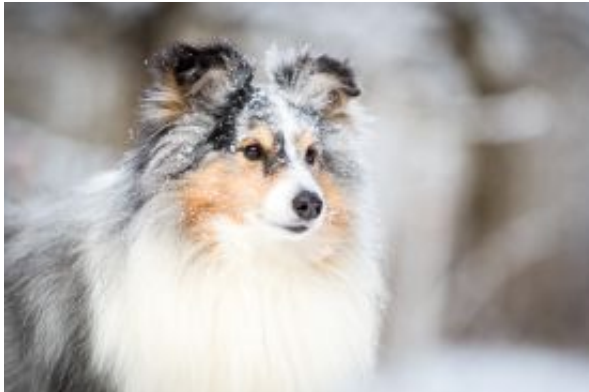
Exciting Starlight Express in blue tollt im Schnee

Unser Schmuckstück. Ein blue merle Rüde mir sehr gleichmäßiger, dunkler Färbung und sehr viel Weiß. Das ergibt bestimmt später einen tollen Kontrast. Er hat eine durchgehende weiße Halskrause, Die Hinterfüße sind fast komplett weiß, wie auch ein Vorderfuß. Der andere Vorderfuß ist zu Hälfte weiß und blue merle gefärbt. Ein Gesicht wie die Mama.