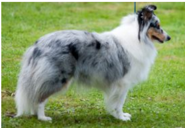
Fabulous Phoebe als erwachsene Hündin