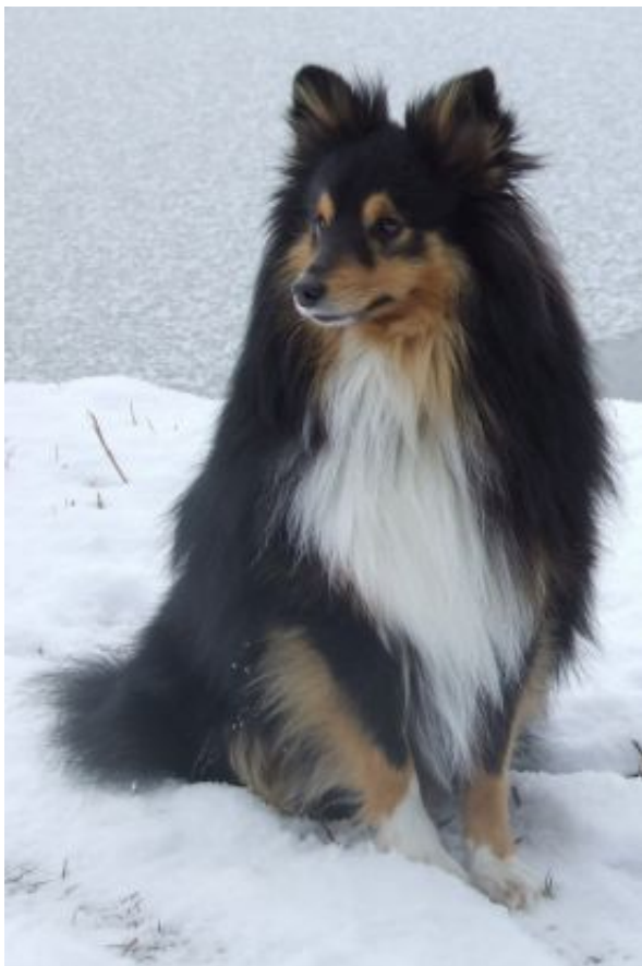
Fantastic Sammy als erwachsener Rüde