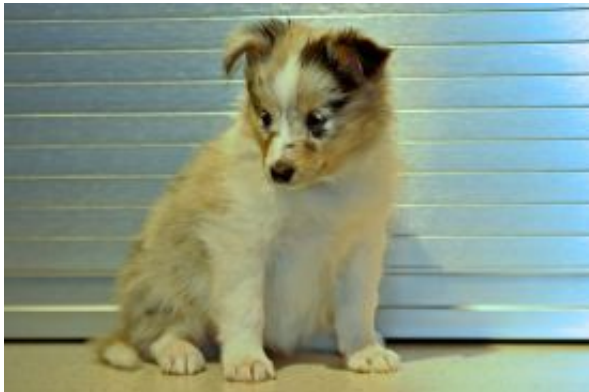
Fabulous Phoebe mit 5 Wochen