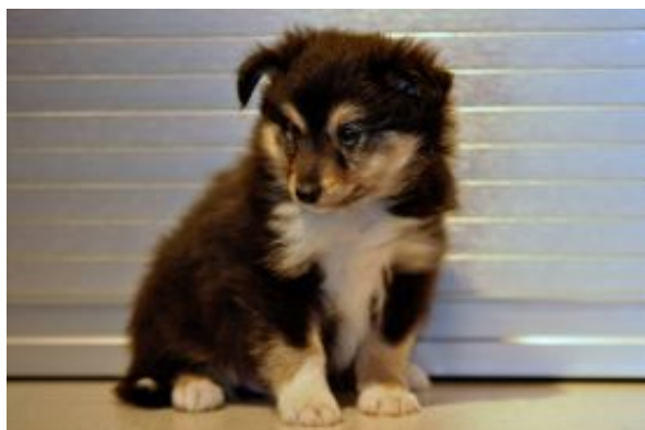
.. Fascinating Sheila mit 4 Wochen