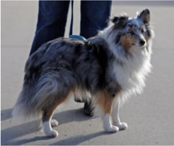
Filou als erwachsener Rüde

Wow - Beauty schenkt uns noch einen Welpen - wieder ein blue merle Rüde. Er ist dunkel/titanfarbig und sehr gleichmäßig. Auch er hat eine breite durchgehende weiße Halskrause. Er ist der schwerste im Wurf und ein hübscher kleiner Kerl.