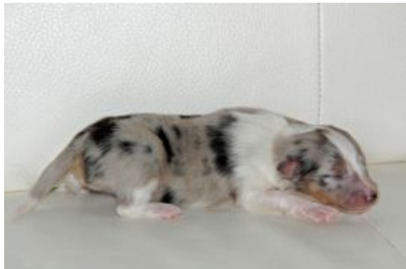
Dash mit einer Woche