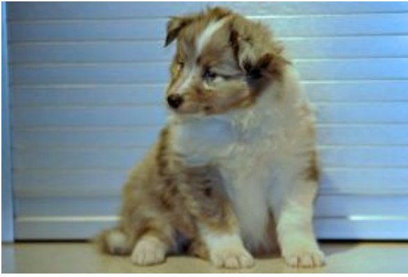
Filou mit 5 Wochen