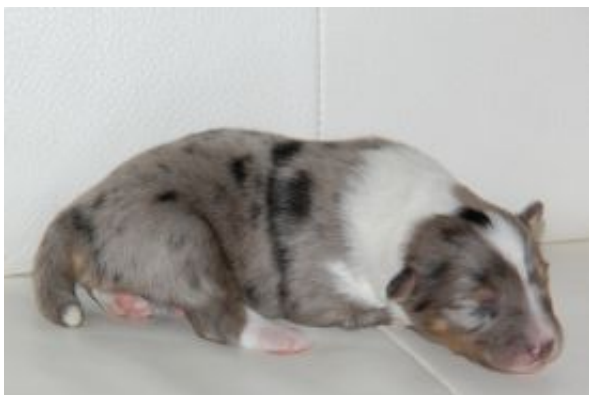
Filou mit einer Woche