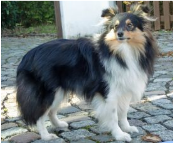
Fascinating Sheila als erwachsene Dame