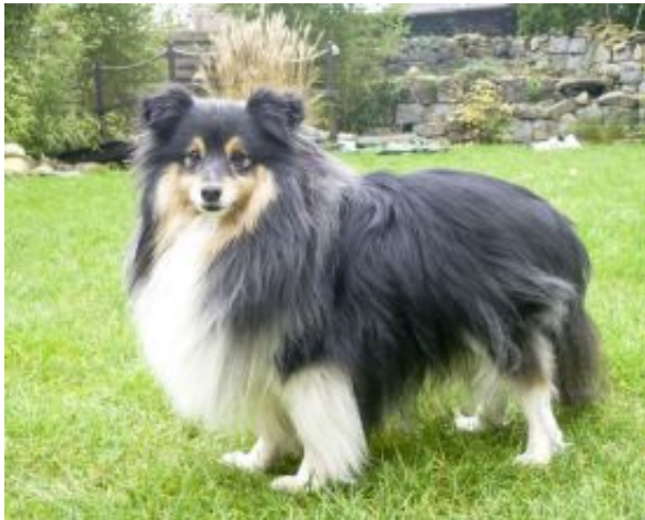
Fascinating Sheila in üppigem Haarkleid