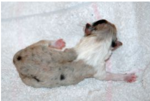
Fabulous Phoebe mit einer Woche