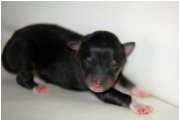
Fantastic Sammy mit einer Woche