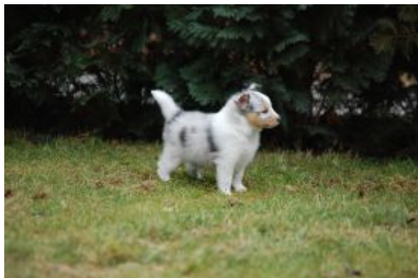
Dash mit 6 Wochen