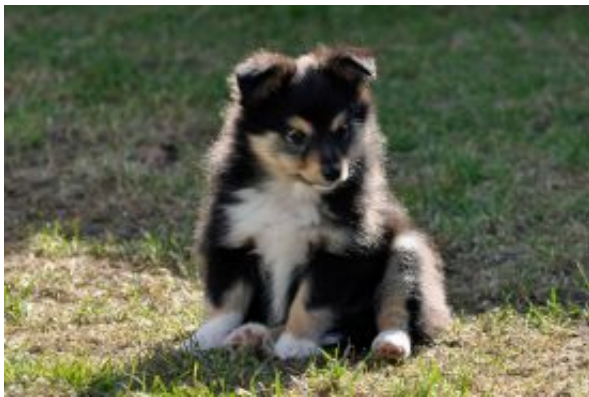
Fantastic Sammy mit 8 Wochen